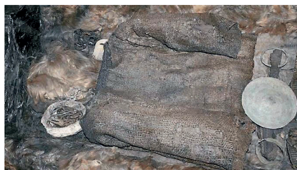
Egtvedpigen, Nationalmuseet, Danmark

Egtvedpigen er et berømt gravfund fra bronzealderen. I 1370 f.kr. blev hun begravet i en egekiste og sat i en gravhøj. Egtvedpigen så igen dagens lys, da hendes grav blev udgravet i 1921 – efter næsten 3500 år. Egtvedpigen, der i dag ligger på Nationalmuseet, omtales som et af danmarkshistoriens bedst bevarede bronzealderfund. Klædedragten er meget velbevaret, så det er et unikt fund, selvom pigens hud og kropsdele er helt borte.