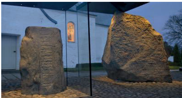
Jellingestenene i monter

I 1994 blev monumenterne optaget på UNESCOs liste over verdens særligt bevaringsværdige historiske mindesmærker – Verdensarven. UNESCO-monumenterne omfatter de to runesten foran kirken, selve Jelling Kirke og de to store høje nord og syd herfor. Under dem ligger bl.a. resterne af en stor skibssætning 1 .